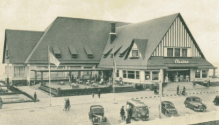
Le célèbre et emblématique édifice de style normand dans les années 1950.