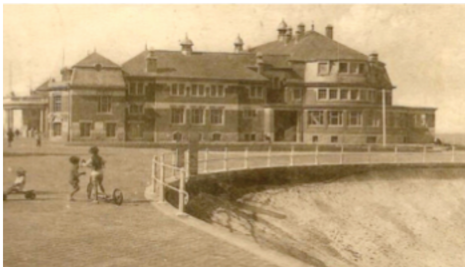
Casino de Middelkerke en 1930.

Après l'Armistice, le casino fut reconstruit et fit encore l'objet de restaurations en 1936, avant de subir les ravages de la Seconde Guerre mondiale.