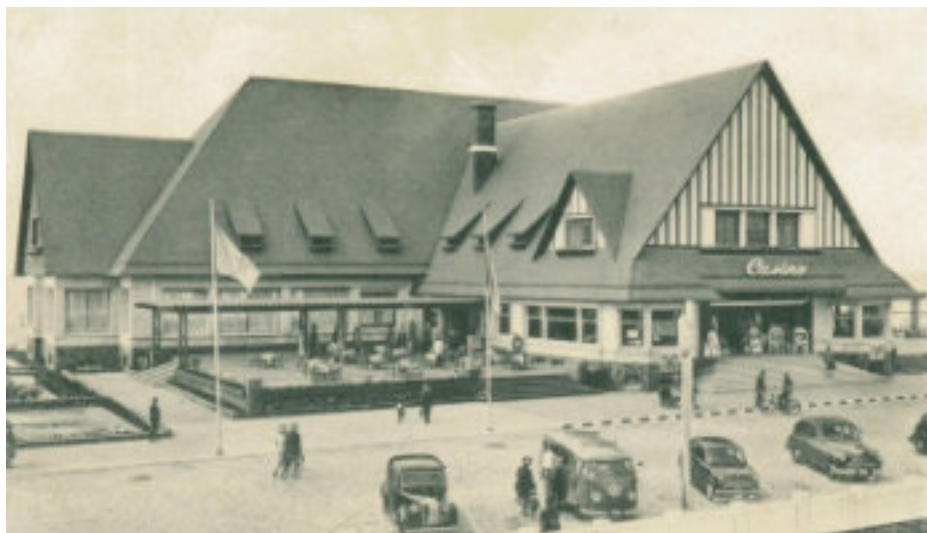
Le célèbre et emblématique édifice de style normand dans les années 1950.