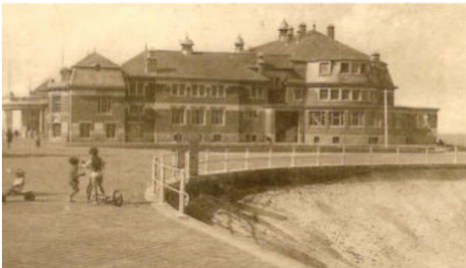
Casino de Middelkerke en 1930.

Après l'Armistice, le casino fut reconstruit et fit encore l'objet de restaurations en 1936, avant de subir les ravages de la Seconde Guerre mondiale.